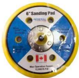
ALMOADILLAS 6" VELCRO DISCO LIJADORA