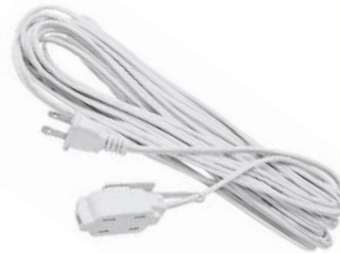
EXTENCION ELECTRICA 4 ENTRADAS