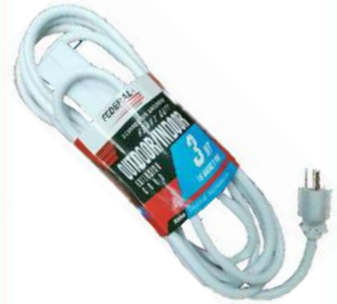
EXTENCION ELECTRICA 3 ENTRADAS