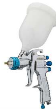
PISTOLA NEUMATICA DE PINTAR- CROMADA BOQUILLA MEDIDA:1.4 MM