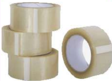
CINTA DE EMBALAR