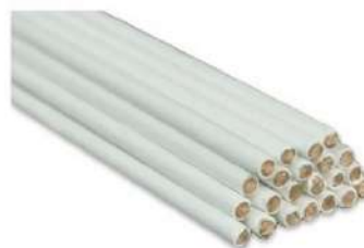
VARILLA DE BRONCE REVISTIDA DE BORAX