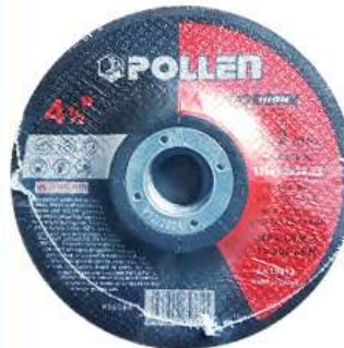
DISCO DE CORTE ULTRAFINO 4 1/2"