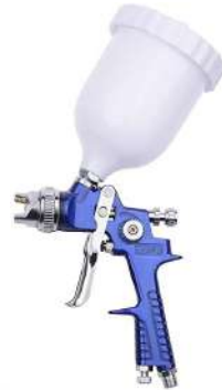
PISTOLA NEUMATICA DE PINTAR BOQUILLA DE:1.4 MM