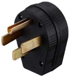
SOCATE ENCHUFE MACHO 4 CONTACTOS