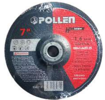
DISCO DE CORTE ULTRAFINO 7"