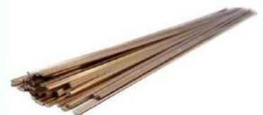
VARILLA DE PLATA AL 0% SOLDAR