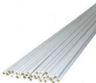
VARILLA DE BRONCE REVISTIDA DE BORAX