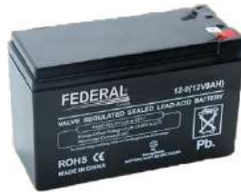
BATERIA GENERADOR SELLADA